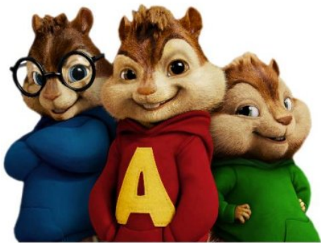
How ya doing?