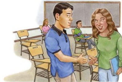
delighted to meet you (f)