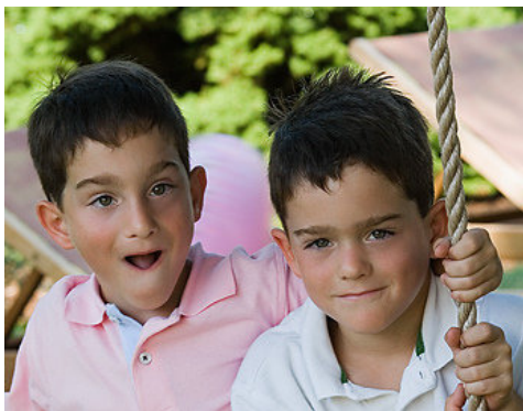
This is my friend (boy)