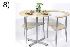
the little table