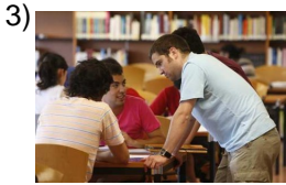
from bad to worse