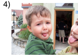
at the same time