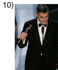
better and better _____