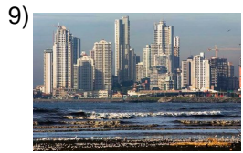
bigger and bigger _____

Words to Match: en vez de - a veces - cada vez peor - de una vez - a la vez - tal cual vez - tal vez - cada vez mayor - alguna vez - cada vez mejor