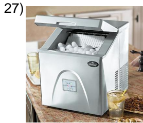
icemaker, portable cooler