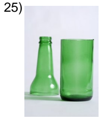
the bottle, jar

Words to Match: el basurero - el cepillo - la hielera - el cuchillo - la manteca - el plato - la estufa - el jabón - cafetera - el frasco - la licuadora - el vaso - los trastes - la esponja - rallador - el platillo - tazón - la sopa de papas - el horno - copas - los tenedores - ollas - los cerillos - el lavaplatos - gabinetes aéreos - rodajas - el litro - el ingrediente - la copa - las tenazas - la cucharada - los fósforos