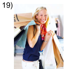
to go shopping