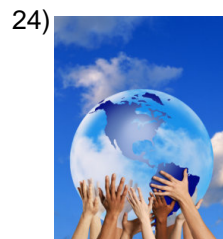
to give back, to return