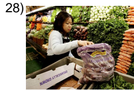
health food store